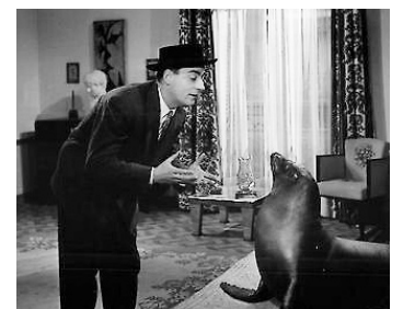
1950 MON PHOQUE ET ELLES de Pierre Billon