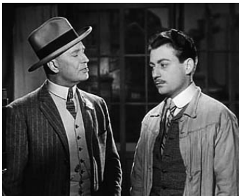
1947 LE SILENCE EST D'OR de René Clair avec Maurice Chevalier