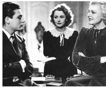
1938 LE VEAU GRAS de Serge de Poligny avec Micheline Buière, Elvire Popesco