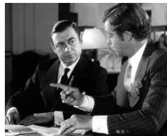
1973 STAVISKY d'Alain Resnais avec Jean-Paul Belmondo