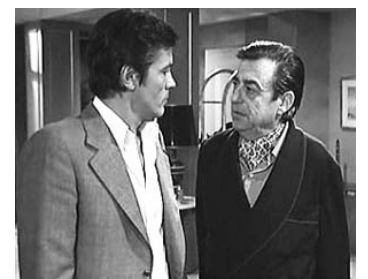
1982 LE BATTANT d'Alain Delon avec Alain Delon