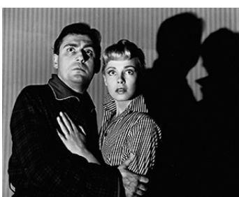
1951 ELLE ET MOI de Guy Lefranc avec Dany Robin