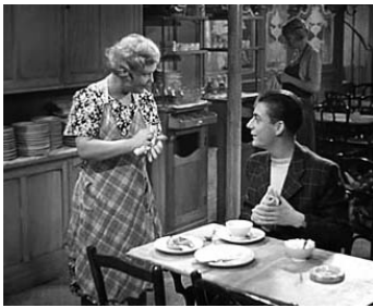
1938 HÔTEL DU NORD de Marcel Carné avec Jane Marken, Raymone