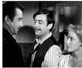
1955 GERVAISE de René Clément avec Armand Mestral, Maria Schell