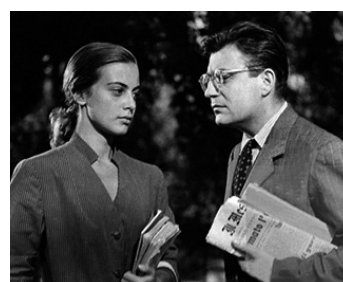
1953 LES AMANTS DE LA VILLA BORGHESE de Gianni Franciolini avec Anna Maria Ferrero