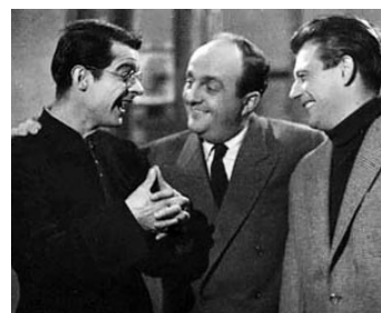
1950 LES ANCIENS DE SAINT-LOUP de Georges Lampin avec Serge Reggiani, Bernard Blier