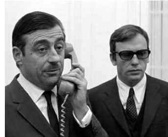
1968 Z de Costa-Gavras avec Jean-Louis Trintignant