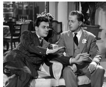
1948 JEAN DE LA LUNE de Marcel Achard avec Claude Dauphin