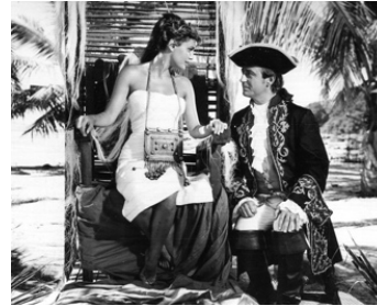
1957 LA BIGORNE, CAPORAL DE FRANCE de Robert Darène avec Rossana Podesta