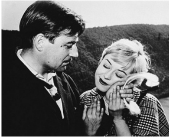
1956 LES NUITS DE CABIRIA (Le Notti di Cabiria) de Federico Fellini avec Giuletta Masina