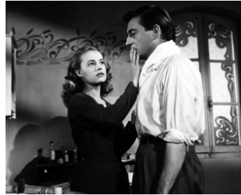
1957 LES LOUVES de Luis Saslavsky avec Jeanne Moreau