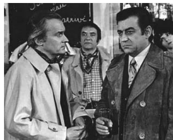
1971 JUSTE AVANT LA NUIT de Claude Chabrol avec Michel Bouquet, Jean Carmet