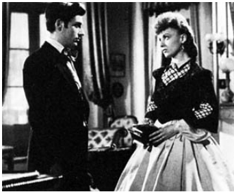
1942 LETTRES D'AMOUR de Claude Autant-Lara avec Odette Joyeux