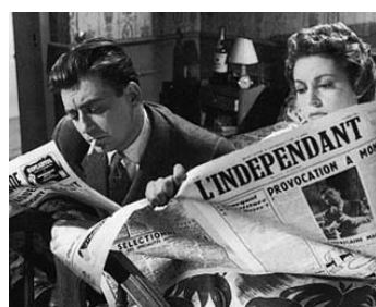
1952 JEUNES MARIÉS de Gilles Grangier avec Anne Vernon