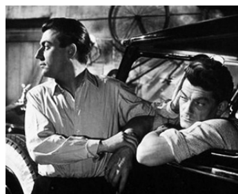
1949 ORPHÉE de Jean Cocteau avec Jean Marais