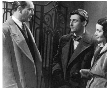
1946 UN REVENANT de Christian-Jaque avec Louis Jouvet, Ludmila Tchérina