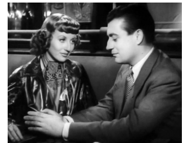
1949 AU P'TIT ZOUAVE de Gilles Grangier avec Marie Daëms