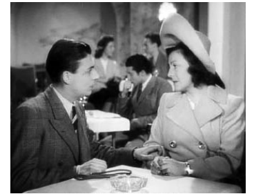
1944 L'ENFANT ET L'AMOUR de Jean Stelli avec Gaby Morlay