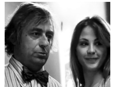
1974 ANTOINE ET SÉBASTIEN de Jean-Marie Périer avec Ottavia Piccolo