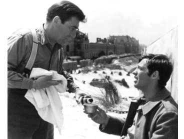
1964 WEEK-END À ZUYDCOOTE d'Henri Verneuil avec Jean-Paul Belmondo