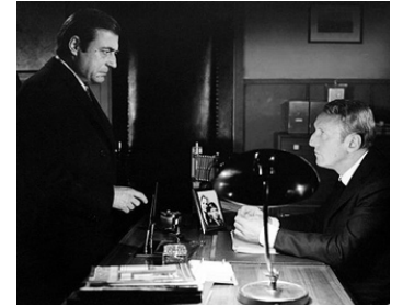
1970 LE CERCLE ROUGE de Jean-Pierre Melville avec André Bourvil