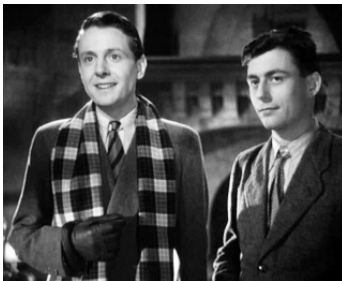
1945 SYLVIE ET LE FANTÔME de Claude Autant-Lara avec Jean Desailly