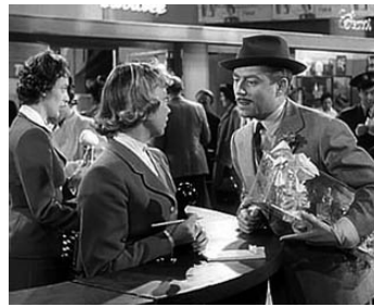
1955 ESCALE À ORLY de Jean Dréville avec Dany Robin