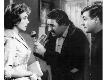
1958 BOBOSSE d'Étienne Périer avec Micheline Presle, Jacques Fabbri