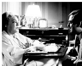
1975 POLICE PYTHON 357 d'Alain Corneau avec Simone Signoret