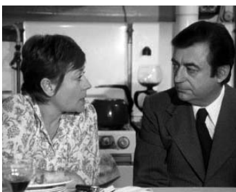
1975 DOCTEUR FRANÇOIS GAILLAND de Jean-Louis Bertucelli avec Annie Girardot