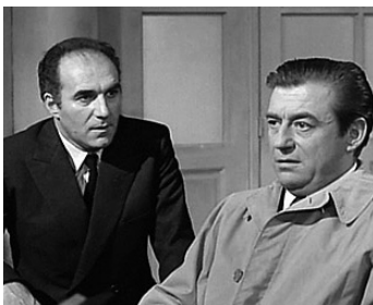
1970 MAX ET LES FERRAILLEURS de Claude Sautet avec Michel Piccoli