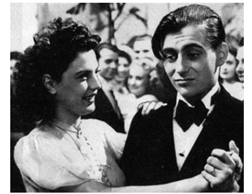
1940 PREMIER BAL de Christian-Jaque avec Marie Déa