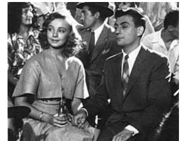
1946 UNE JEUNE FILLE SAVAIT de Maurice Lehmann avec Dany Robin