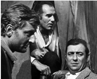
1966 UN HOMME DE TROP de Costa-Gavras avec Bruno Crémer, Michel Piccoli