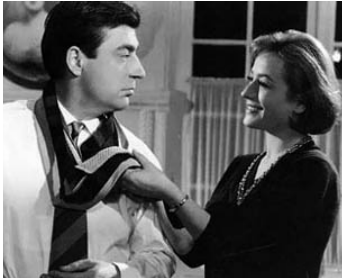
1959 LA CORDE RAIDE de Jean-Charles Dudrumet avec Annie Girardot