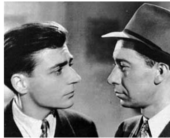
1943 LA FERME AUX LOUPS de Richard Pottier avec Paul Meurisse