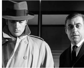
1967 LE SAMOURAÏ de Jean-Pierre Melville avec Alain Delon