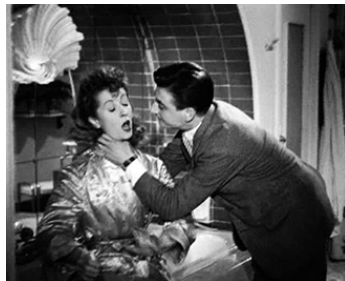
1945 AU PETIT BONHEUR de Marcel L'Herbier avec Danielle Darrieux