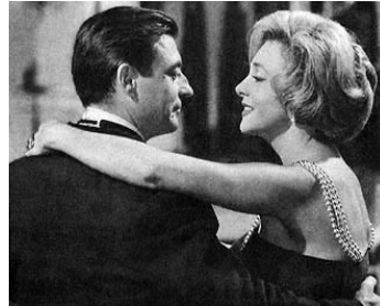
1960 L'AMANT DE CINQ JOURS de Philippe de Broca avec Micheline Presle